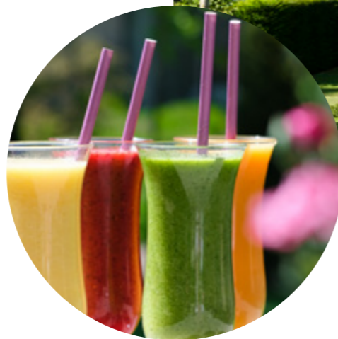
Frische Smoothies fresh smoothies