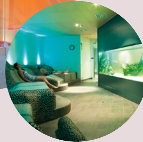
Ruhebereich resting area