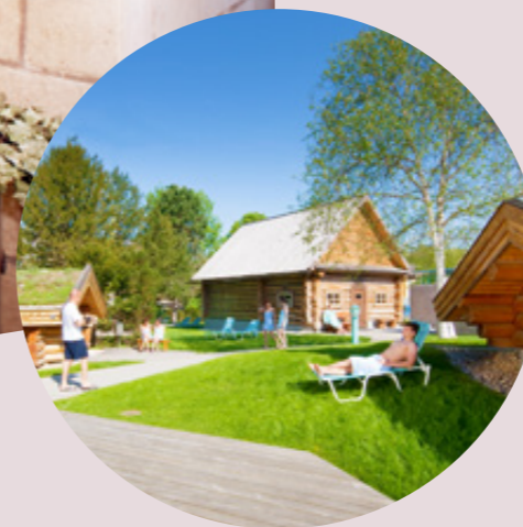
Saunadorf sauna village