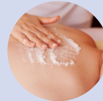
Salz-Peeling salt peeling