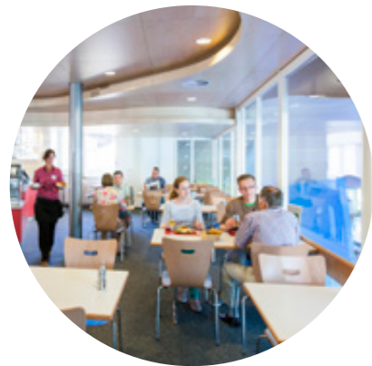
Restaurant Vista Mar restaurant vista mar