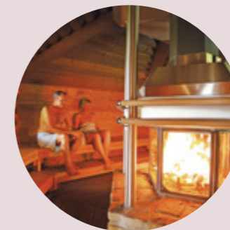
Feuersauna fire sauna