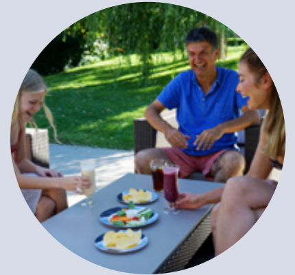
Gastro-Bereich Dining area