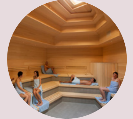
Bio-Sauna bio sauna