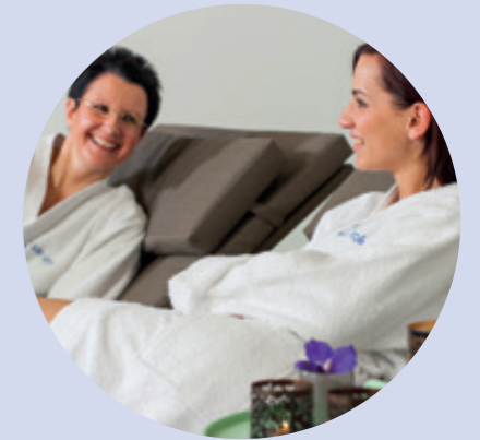
Relax-Bereich relax area